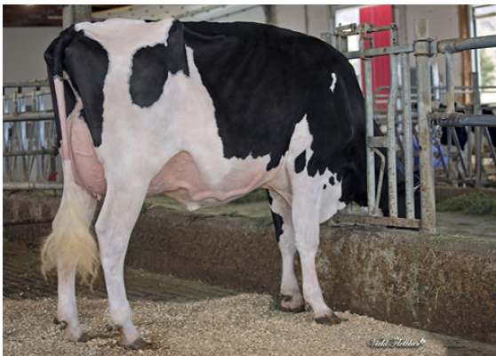
TAPPENVALE DRIFTER MERLOT DAUGHTER