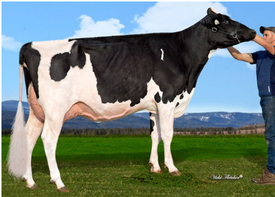
TAPPENVALE DRIFTER MERLOT DAUGHTER