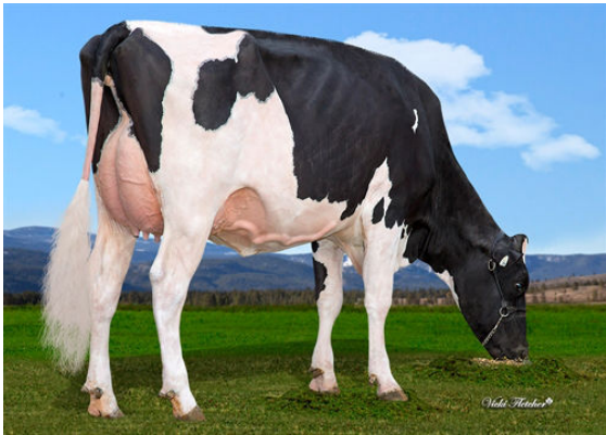
TAPPENVALE DRIFTER MERLOT DAUGHTER